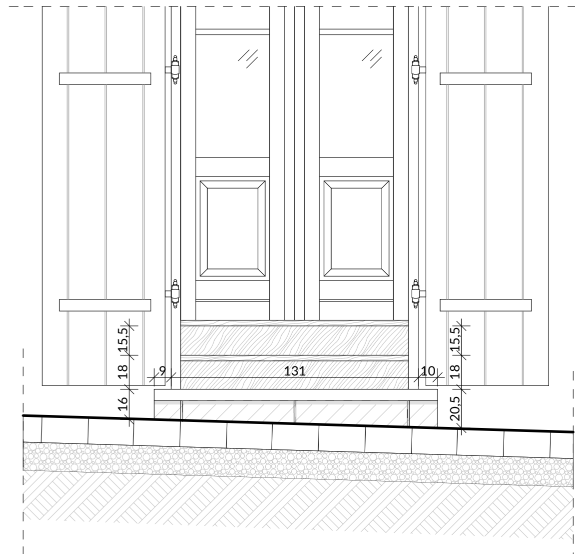
SCHODY WEJŚCIOWE DO LOKALU UŻYTKOWEGO NR 1 - EL. FRONTOWA (POŁUDNIOWA) - WIDOK OD STR. POŁUDNIOWEJ